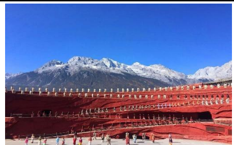
Án tượng Lệ Giang