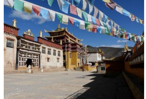
Thành cổ Dukezong

Sau bữa sáng tại khách sạn, đoàn đi Shangrila - “ vùng đất bất tử ” trong tiểu thuyết Lost Horizon (Chân trời đã mất) của nhà văn Anh James Hilton. Theo ngôn ngữ của người Tây Tạng, Shangrila có nghĩa là địa điểm của vận mệnh và sự may mắn, là trung tâm của ba dòng sông lớn Dương Tử, Lan Thương- đoạn đầu của dòng sông Mekong và Nộ Giang.