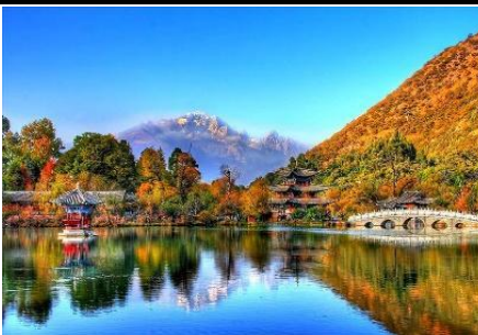
Công viên Hắc Long Đàm