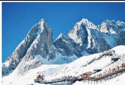
Núi tuyết Ngọc Long