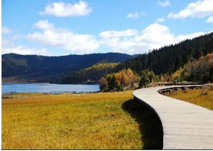
Công viên quốc gia Potatso