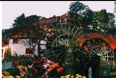
Phố cổ Lệ Giang