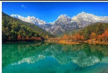
Thung lũng Lam Nguyệt